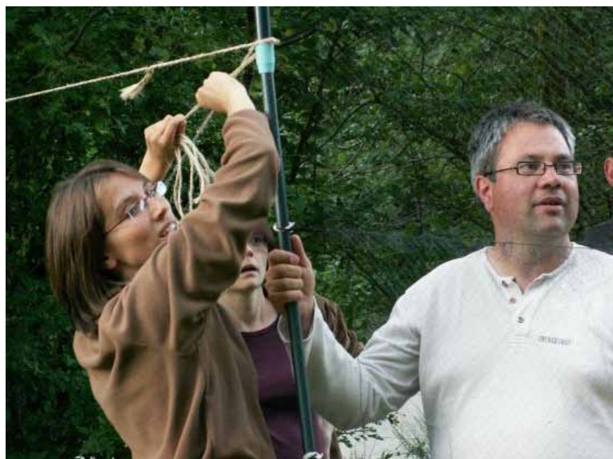
POSE D'UN FILET TONY ROCK

Revogne n'est pas très éloigné de Jemelle, où nous ferons notre camp, mais une autoroute sépare ces deux villages, créant une barrière importante à l'échelle d'un petit rhino. Chaque année, 10 à 20 petits rhinolophes sont recensés dans le coin de Jemelle. D'autres indices s'ajoutent à celui-là pour laisser penser qu'une colonie encore inconnue s'y cache