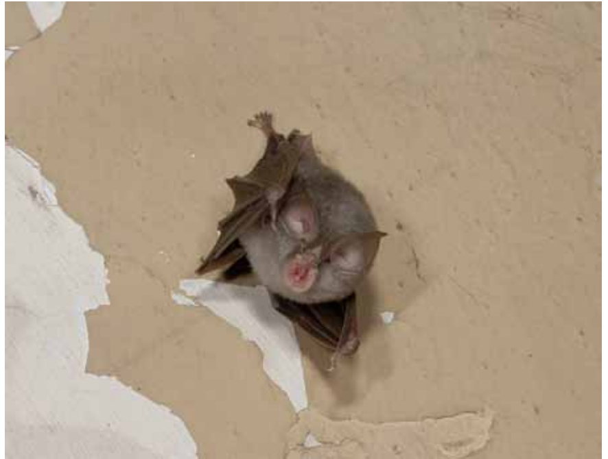
PETIT RHINOLOPHE JEAN-LOUIS GATHOYE

Donc, au programme, balades, études de mammifères souvent méconnus, observations inouïes,... Qu'attendons-nous pour le faire ?